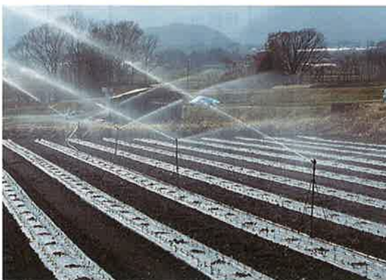
スプリンクラーによる散水

しながら再生をしていきたいと考えています。組合員の皆さんのアイデア、ご提言をいただき、発展をみんなと考えていきたいと思えます。 この土地改良区の運営の課題は、持続可能な組織にしていくことができるかです。 設立当初から変わっていない賦課金については、情勢の変化にそった見直しも必要と指摘されています。論議をしていきたいと考えています。 梅雨明け、猛暑が予想されます。お体には十分ご自愛の上、お励みいただきますよう、ご祈念を申し上げます。